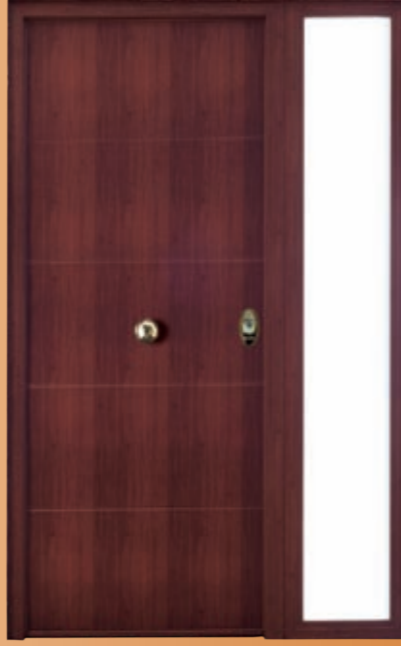
AH-500 CON FIJO